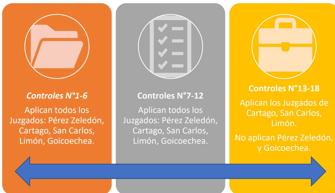
Gráfico N°2