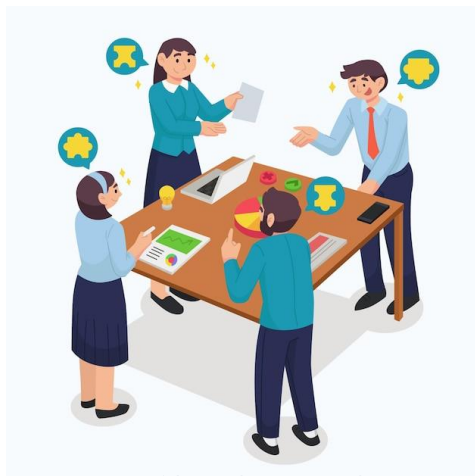
CONTROL INTERNO RESPONSABILIDAD DE TODOS

Los riesgos institucionales se analizan desde el Proceso de Planificación Institucional (objetivos y metas de la organización) para evaluar cómo podrían afectar la capacidad operativa y su cumplimiento, lo cual permite: